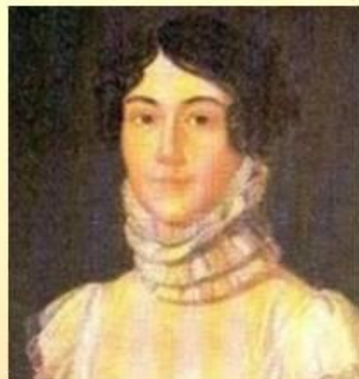
Мария Михайловна Лермонтова