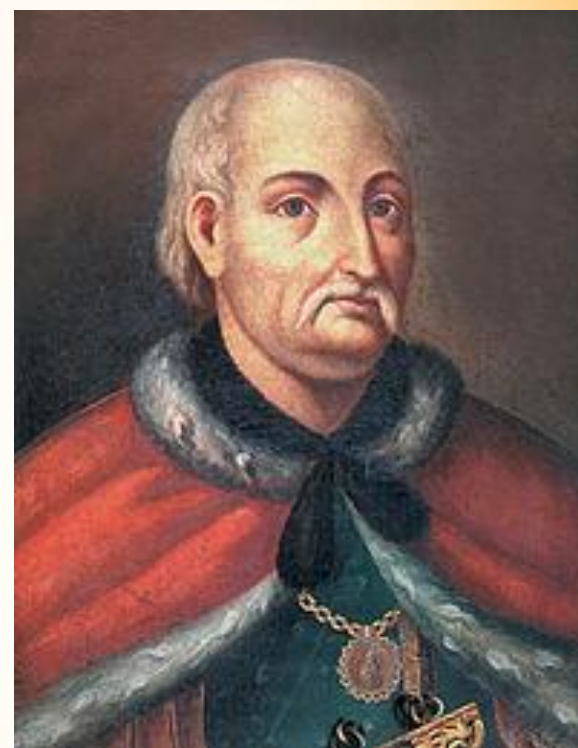
Иван Ильич Скоропадский

Царь Пётр I вплоть до его смерти не разрешал восстанавливать Сечь, хотя такие попытки были. На территории подконтрольных Османской империи казаки попытались основать Каменскую Сечь (1709–1711 годы) . Однако в 1711 году московские войска и полки гетмана И. И. Скоропадского напали на крепость и разрушили её. После этого была основана Алёшковская Сечь (1711–1734 годы) на этот раз под протекторатом крымского хана, но и она просуществовала недолго