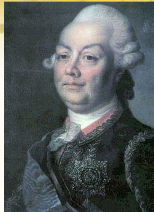
Пётр Александрович Румянцеv

В январе 1771 г. Екатерина II наградила кошевого атамана Запорожского войска П. Калнишевского за заслуги золотой медалью, «осыпанною бриллиантами». Золотых медалей были удостоены ещё 16 человек из высших чинов Запорожского войска