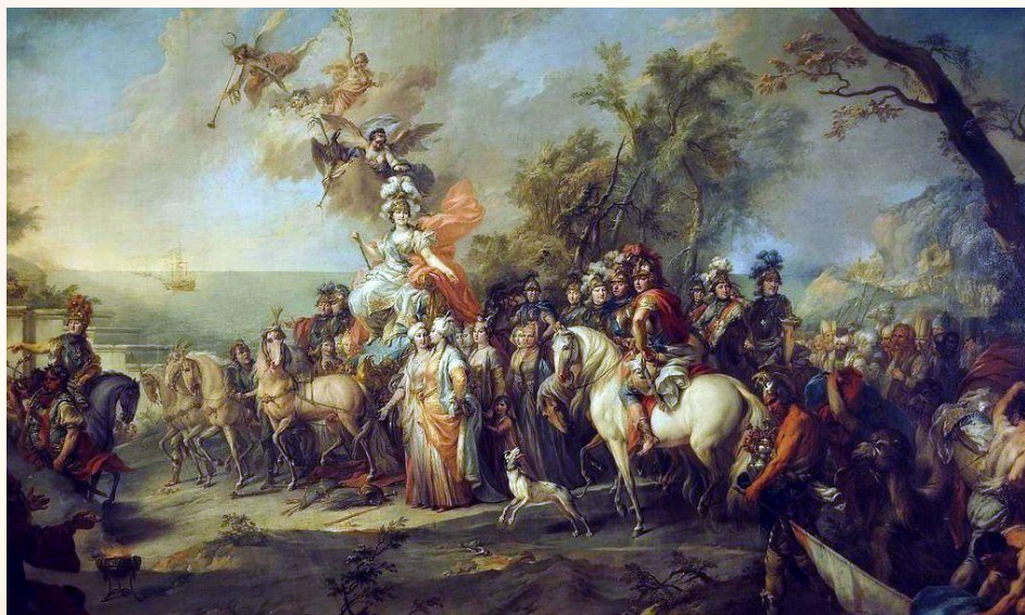
Стефано Торелли. «Аллегория на победу Екатерины II над турками и татарами». 1772.

10 тыс. запорожцев были причислены к армии Румянцева. Казаки не только отличались в разведках и рейдах, но и сыграли важную роль в сражениях при Ларге и Кагуле.