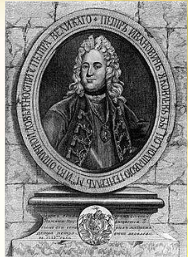
Петр Иванович Яковлев

После того, как Кость Гордиенко и гетман Мазепа подписали с Карлом XII союзнический договор, царь Пётр I отдал приказание князю Меншикову двинуть из Киева в Запорожскую Сечь три полка русских войск под командованием полковника Яковлева с тем, чтобы «истребить всё гнездо бунтовщиков до основания». Подошедший к Сечи полковник Яковлев, чтобы избежать кровопролития, пытался договориться с запорожцами «добрым способом», но зная, что на помощь осаждённым из Крыма может подойти кошевой Сорочинский с татарами, начал штурмовать Сечь. Первый штурм запорожцы сумели отбить, при этом Яковлев потерял до трёхсот солдат и офицеров. Запорожцам даже удалось захватить какое-то количество пленных, которых они «срамно и тирански» убили.