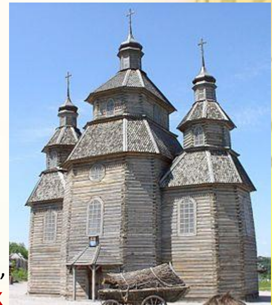
Церковь Покрова Пресвятой Богородицы, остров Хортица, Современная реконструкция