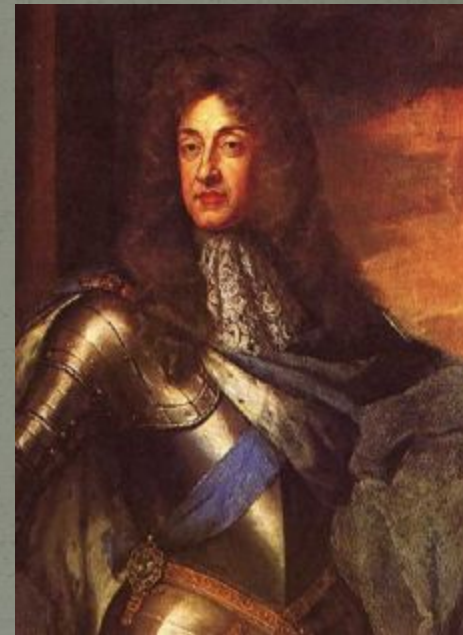
Яков II 1685 - 1688

Преследование пуритан Преследование революционеров Попытка восстановить католицизм