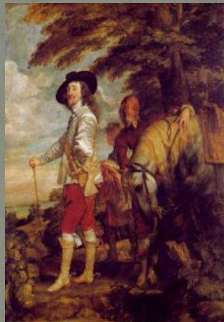
Карл I (1625 – 1649)

«Как мои предки могли допустить подобное учреждение?»