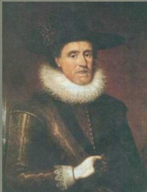
Яков I (1603 - 1625)