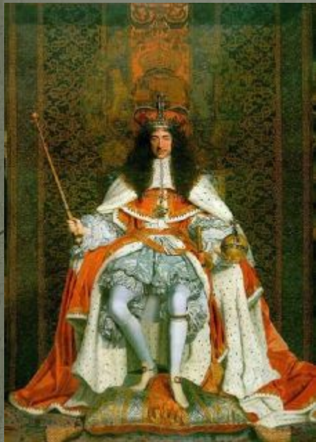
Карл II 1661 - 1685