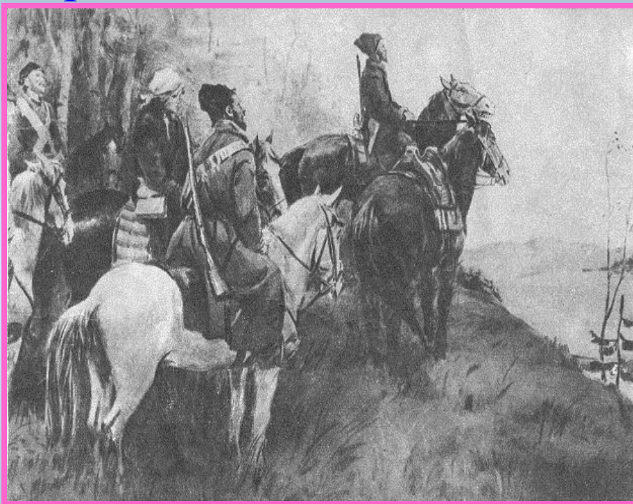
Отряд Левинсона. С рисунка Д. Дубинского

проследим путь Мечика от 1 главы до конца романа