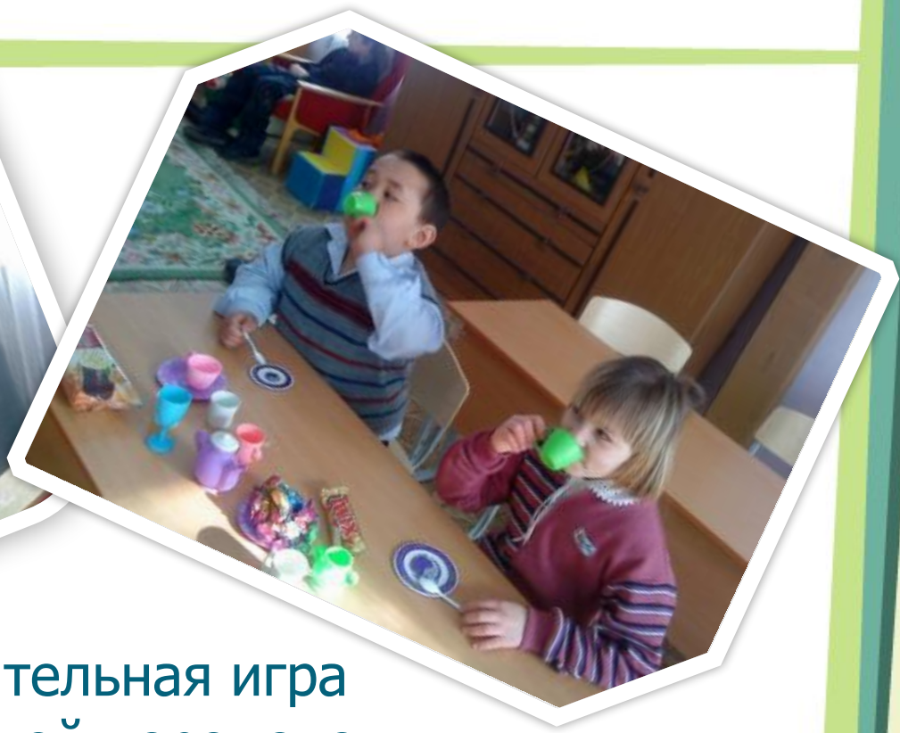
Самостоятельная игра на большой перемене