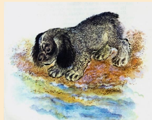
Евгений Иванович Чарушин (1901 - 1965)