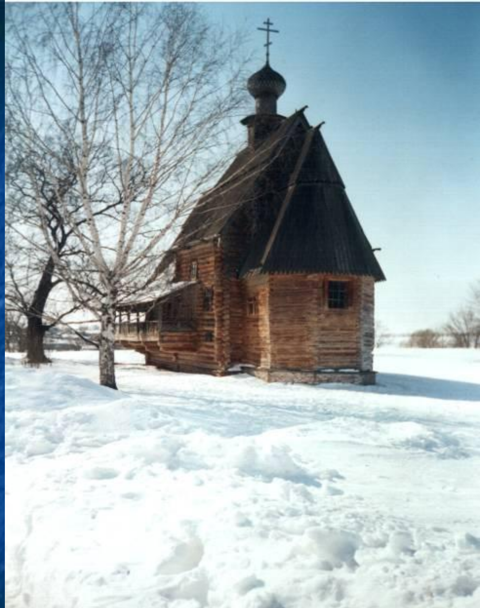
Церковь, в которой снималась сцена венчания

«Владимир с ужасом увидел, что он заехал в незнакомый лес. Отчаяние завладело им . . . Владимир схватил себя за волосы и остался недвижим как человек, приговорённый к смерти . . . Церковь была заперта. Какое известие ожидало