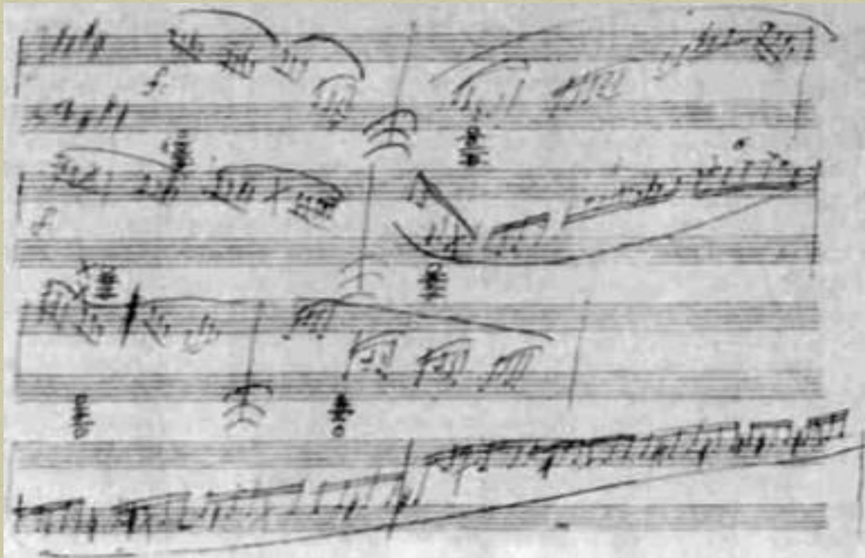
« Лунная соната» автограф