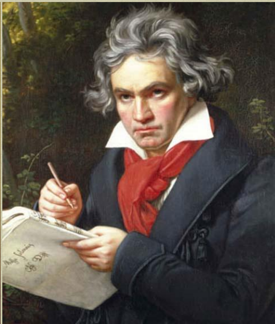
Людвиг ван Бетховен