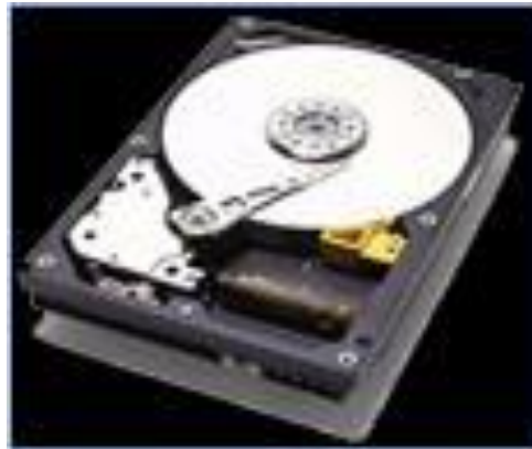
Қатқыл диск Винчестер