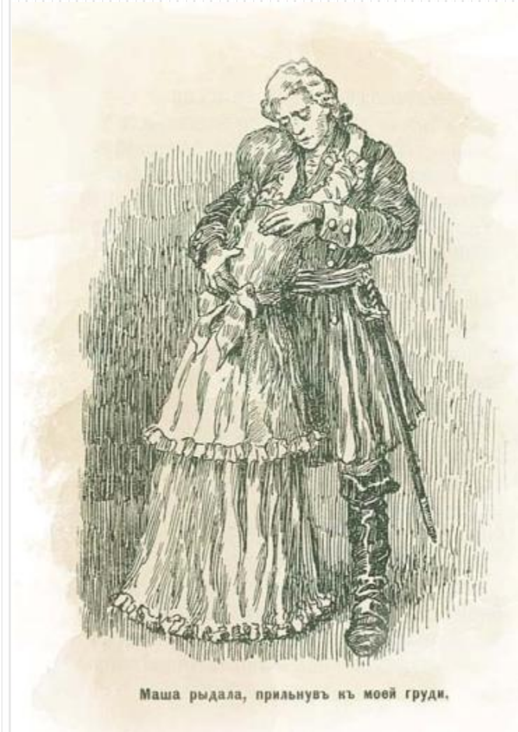
Маша рыдала, прильнув к моей груди.

Попав в критическую ситуацию, Маша раскрывается с новой стороны. Она проявляет неслыханную стойкость и силу духа, оказавшись в руках ненавистного Швабрина. Маша решается в одиночку бороться за свое счастье