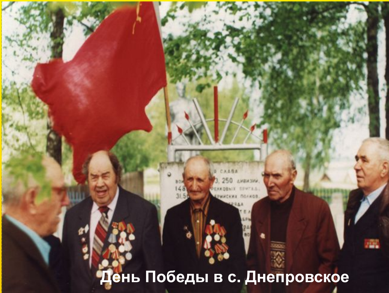
День Победы в с. Днепроовское

Чтоб не пылать земному шару снова, Солдатской крови пролито сполна. Чтоб помнил враг урок войны суровой! Фронтовики, наденьте ордена!