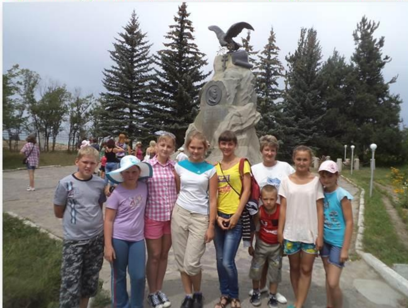
Кыргызстан. Каракол. Музей Н.М. Пржевальского лето 2013 год.