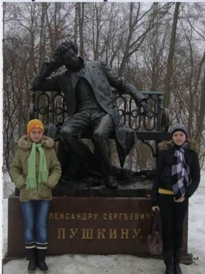
Санкт-Петербург. Царское Село. 2010 год.