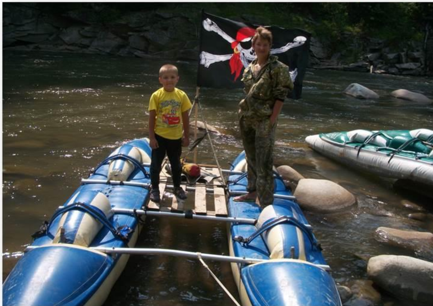
Алтай. Сплав по р.Песчаной на катамаранах лето 2012год.

с использованием различных видов транспорта