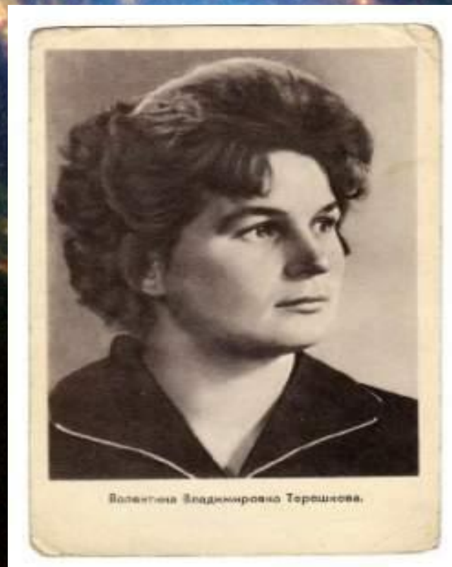
Валентина Владимировна Терешкова.