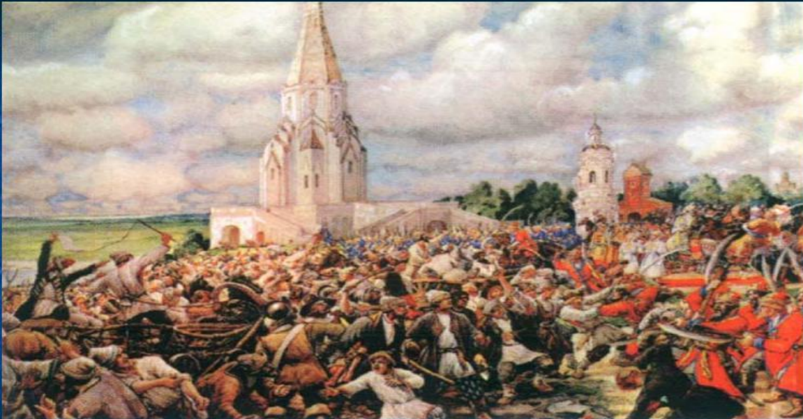
Э. Лисснер. Медный бунт в Москве

Современники называли XVII век «бунташным», так как закрепощение крестьян, усиление налогового гнёта и т.д. вели к массовым народным выступлениям. (Соляной бунт в 1648 г., Медный бунт в 1662 г., восстание Степана Разина, выступления старообрядцев)