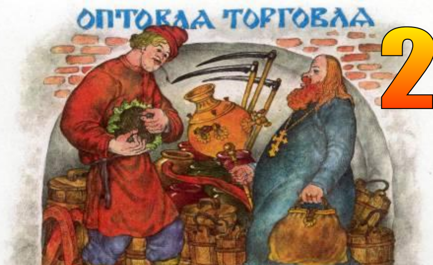
«Сказка о попе и о работнике его Балде»