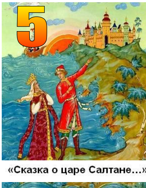
«Сказка о царе Салтане...»