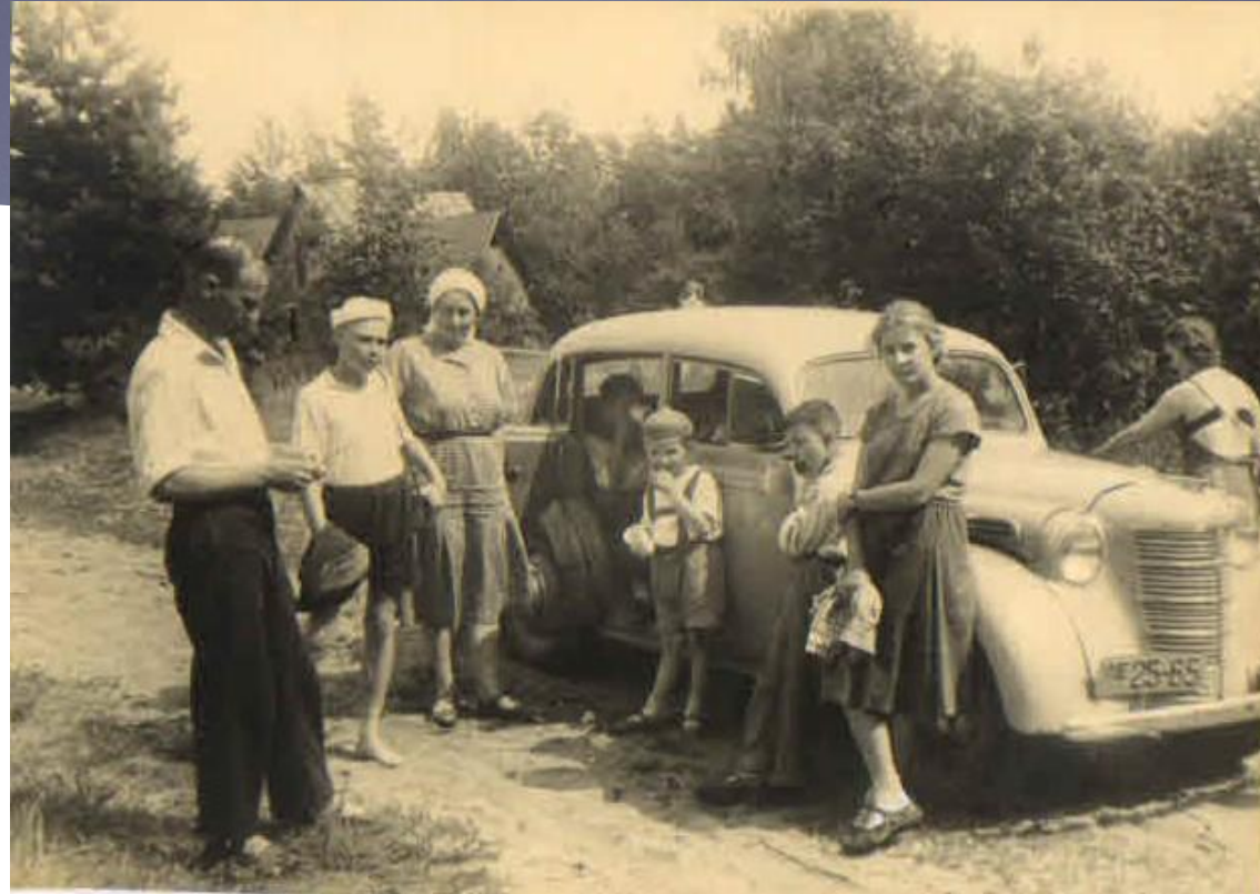
Выезд семьи на дачу. 1950 г.