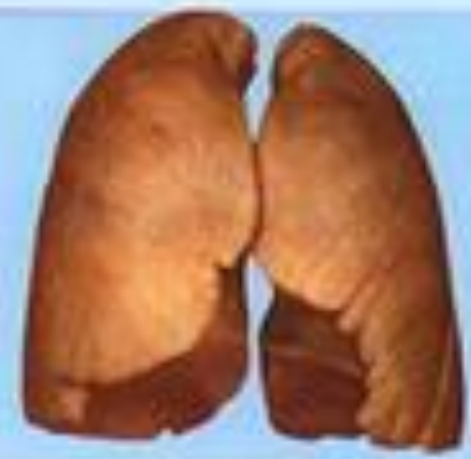
Лёгкие человека некурящего