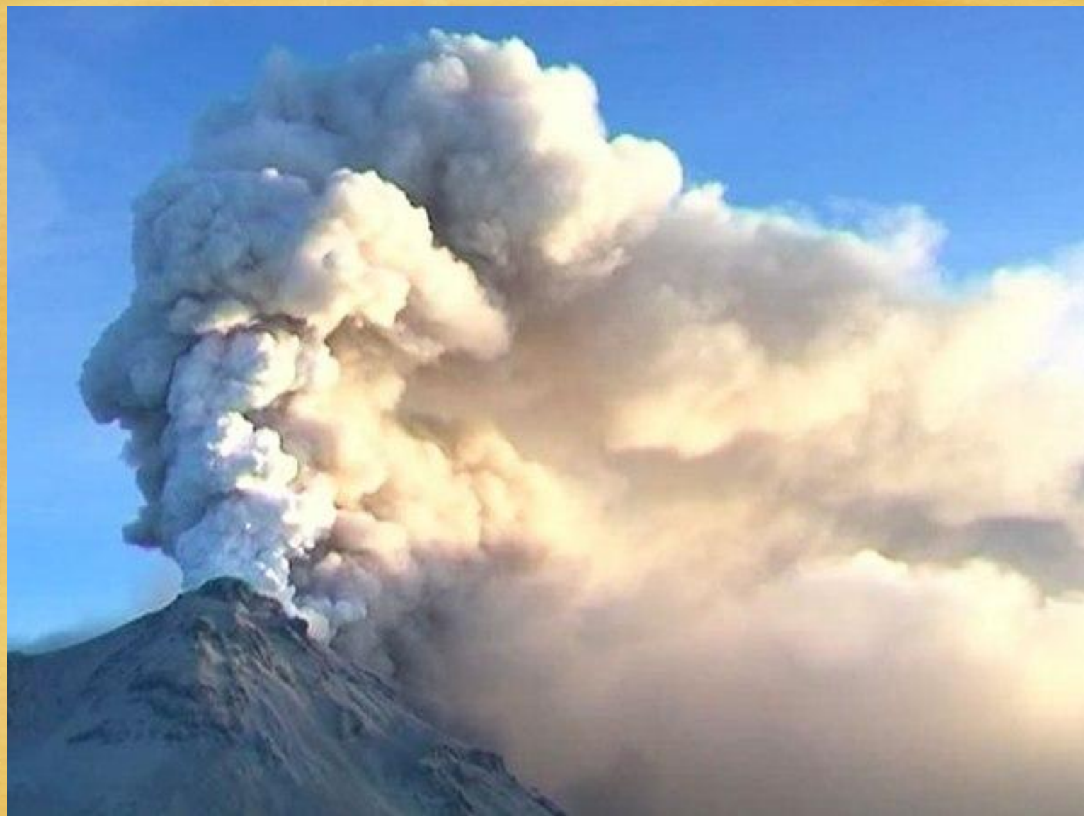
Извержение вулкана Безымянный