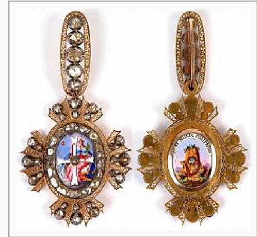
Знак ордена Св. Екатерины 2-й ст. Лицевая и обратная стороны.