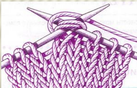
Убавки по две петли вместе