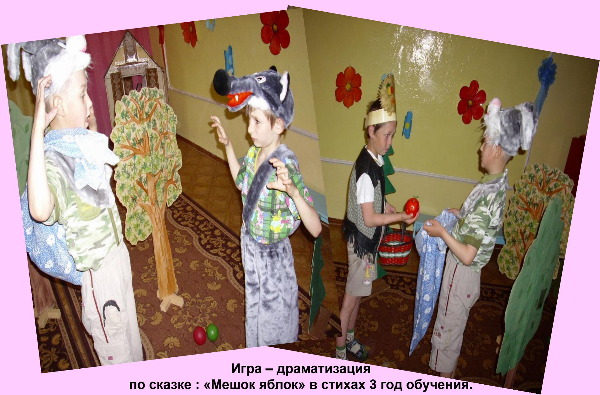
Игра – драматизация по сказке : «Мешок яблок» в стихах 3 год обучения.