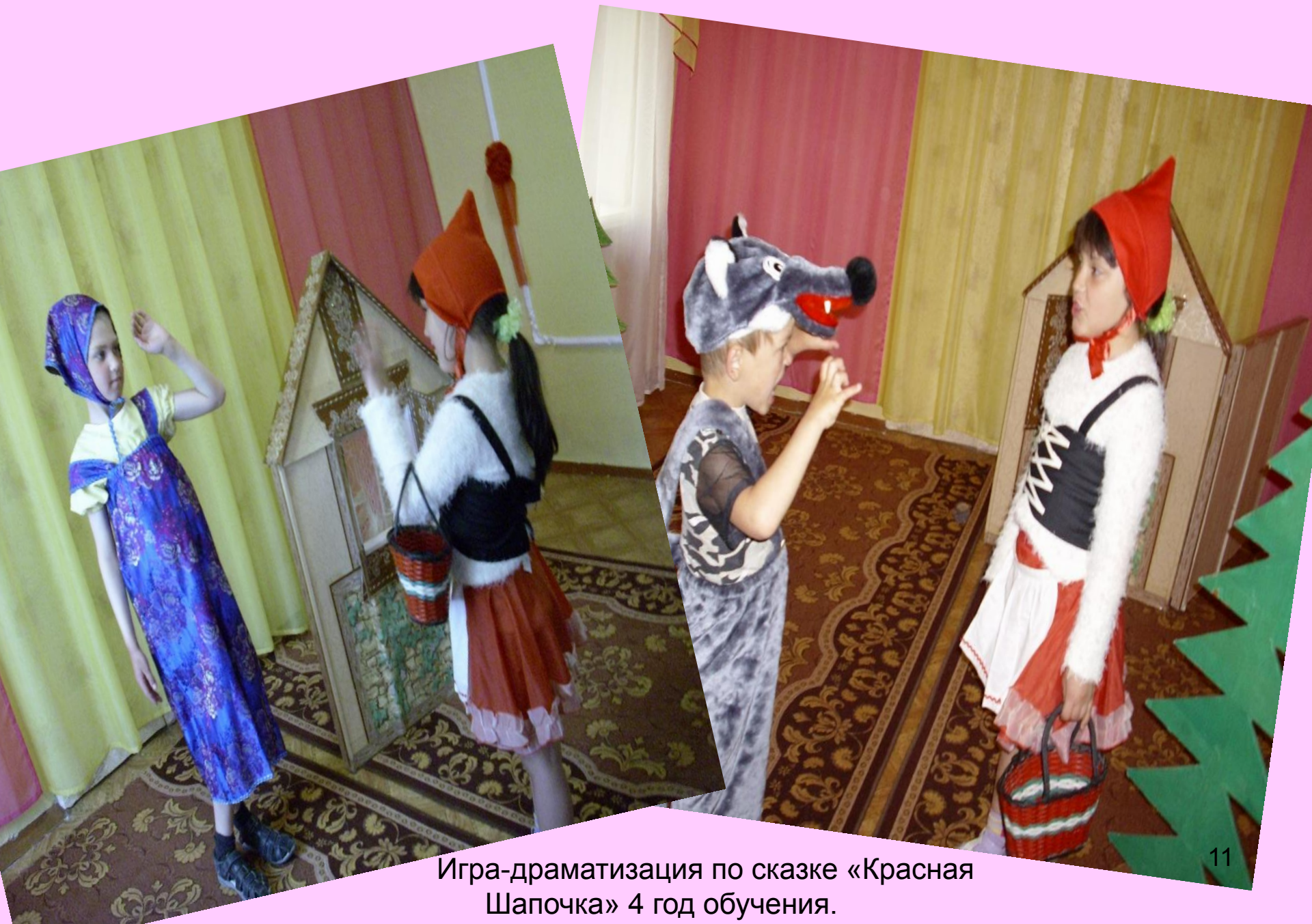
Игра-драматизация по сказке «Красная Шапочка» 4 год обучения.