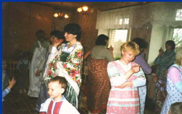
Разучим народный танец

Кто с платочком пляшет Да на балалайке играет, Тому скучно не бывает. Веселитесь, веселитесь, веселитесь от души, Потому что в нашем крае Игры больно хороши.