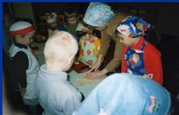
Мы с ребятами пирог испечем...

Две старушки старые Пироги поставили. Поставили на дрожжах – Не удержишь на вожжах. Добавили гущи – Они киснут пуще. Прибавили молока – Повалились на бока. Подбавили маслица – Они стали кваситься. Пироги хорошие И очень пригожие: С маслом, с капусткой И еще с картошечкой