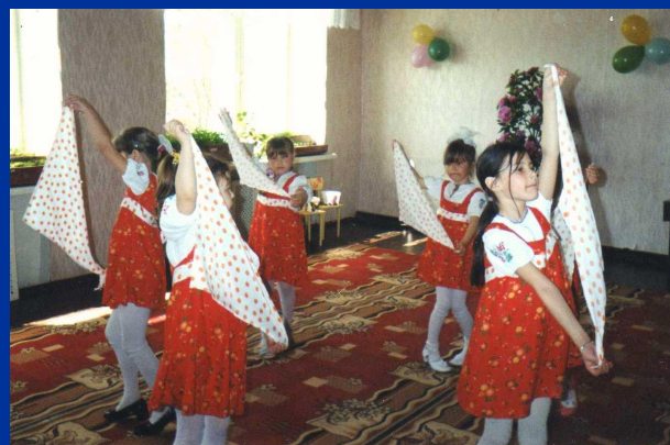
Танец с платками