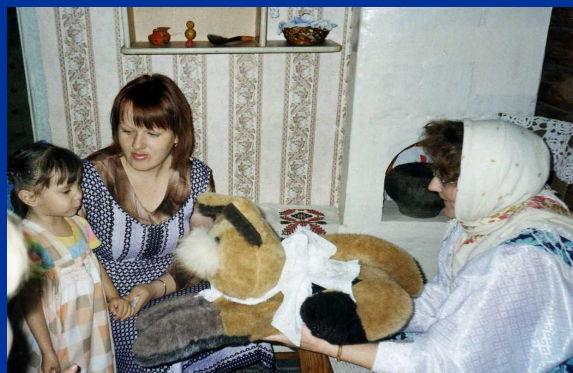
Как у нашего кота...

Как уютна наша горница – Спозоранку печка топится, Котик лапкой умывается, Новый день начинается.