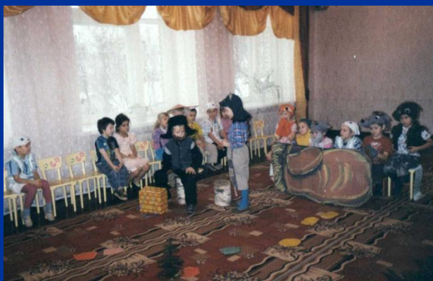
Инсценировка русской народной Сказки «Рукавичка»