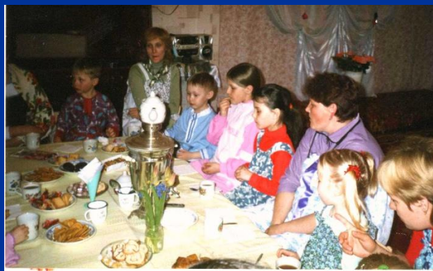
Как приятно с мамами попить чайку

Ой, чай, крепкий чай, Пейте чай-чаечек, Чтобы радость приносил Каждый день- денечек.