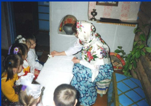
Разучим потешку про козлика