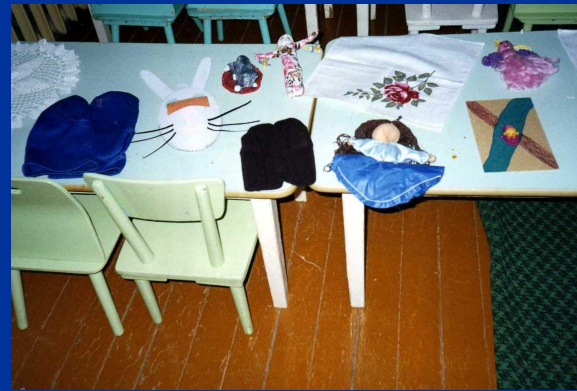
Товары – своими руками

А тари, тари, тари! Куплю Маше янтари. Останутся деньги, Куплю Маше серьги, Останутся пятаки, Куплю Маше башмаки, Останутся грошики, Куплю Маше ложки, Останутся полушки, Куплю Маше подушки.