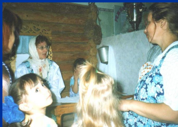
Весела была беседа