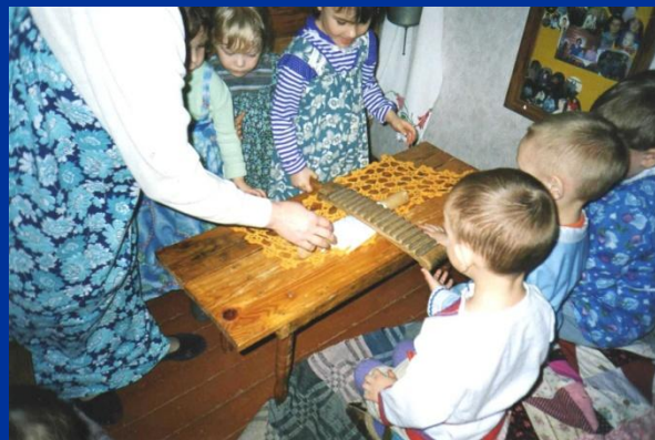
Так в старину гладили белье