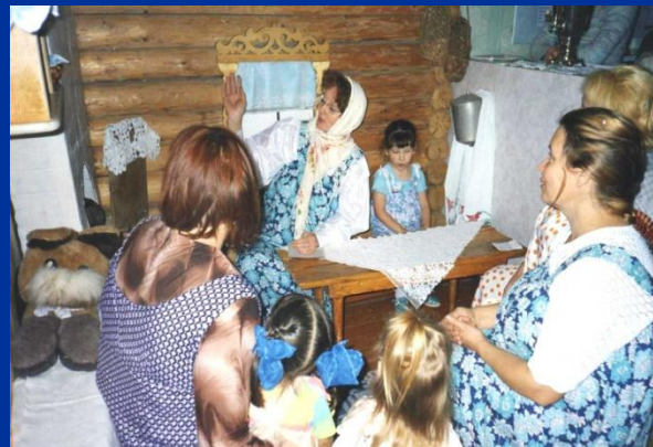
Там за печкой живет Домовой

Чем дальше в будущее смотрим, Тем дольше прошлым дорожим, И в старом красоту находим, Хоть новому принадлежим.