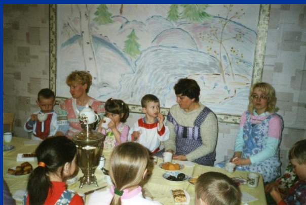
Мы за чаем не скучаем...