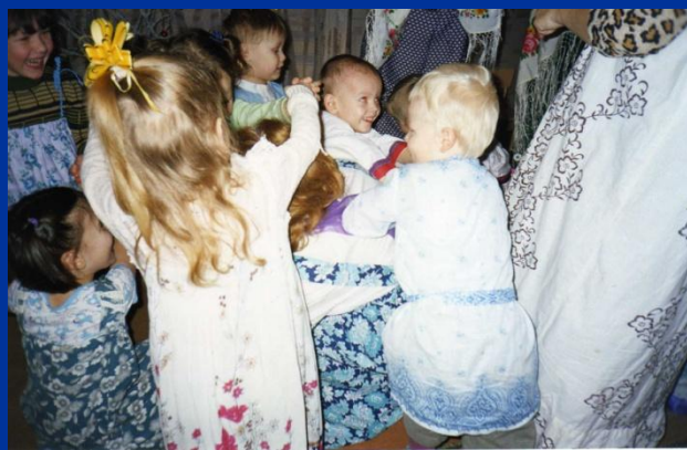
Поиграем в народную игру