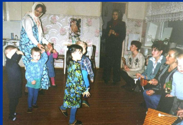
Мамы сыграют на музыкальных инструментах