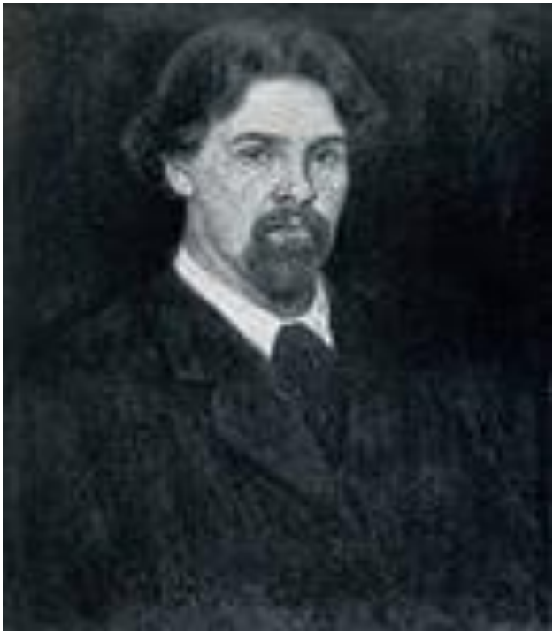
ВАСИЛИЙ ИВАНОВИЧ СУРИКОВ