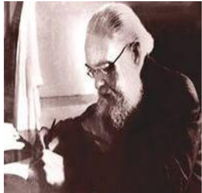
ВАЛЕНТИН ФЕЛИКСОВИЧ ВОЙНО-ЯСЕНЕЦКИЙ (ЕПИСКОП ЛУКА)