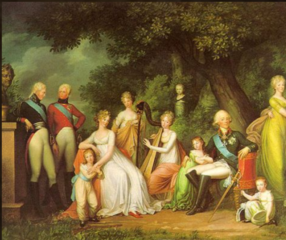
Император Павел I с семьей.