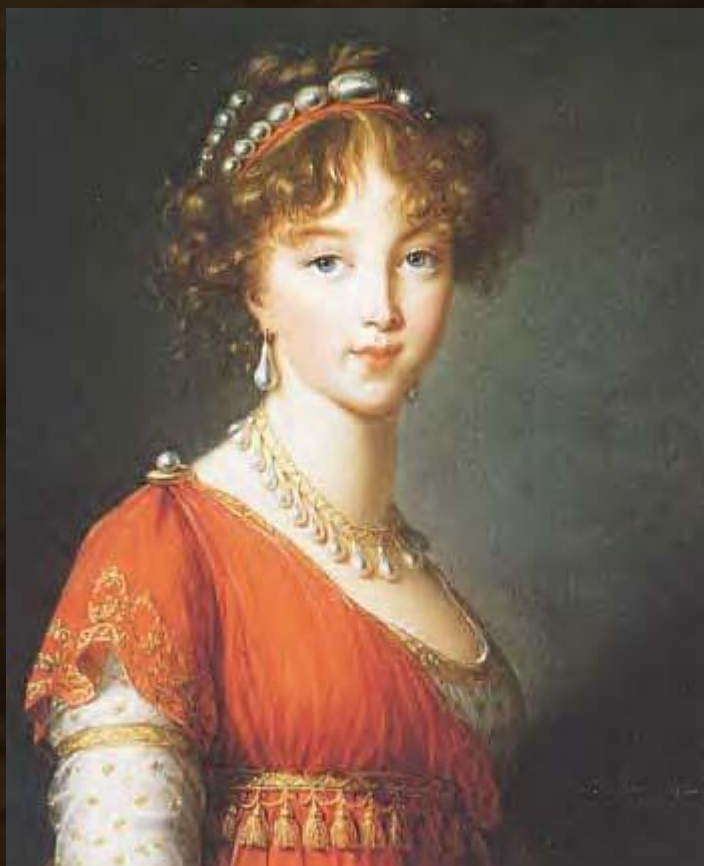
Луиза Мария Августа (Елизавета Алексеевна).

В 1793 Александр женился на дочери маркграфа Баденского Луизе Марии Августе ( Luise Marie Auguste von Baden ), принявшей имя Елизаветы Алексеевны.