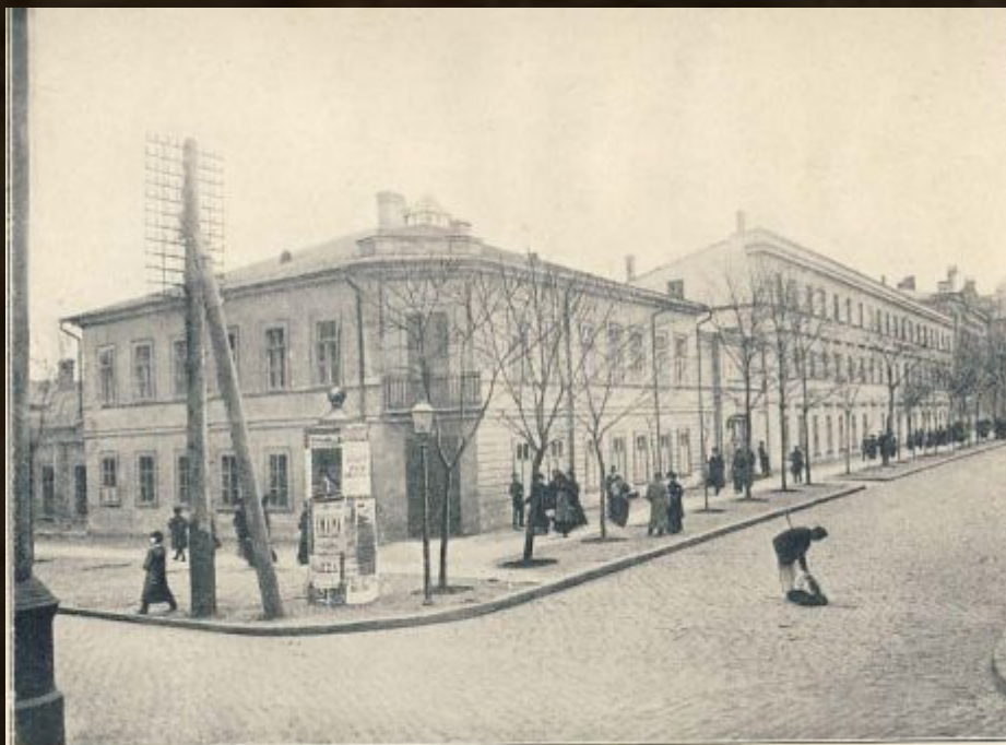
Первая мужская гимназия (Ришельевская). — Gymnase Richelieu (Garçons.)