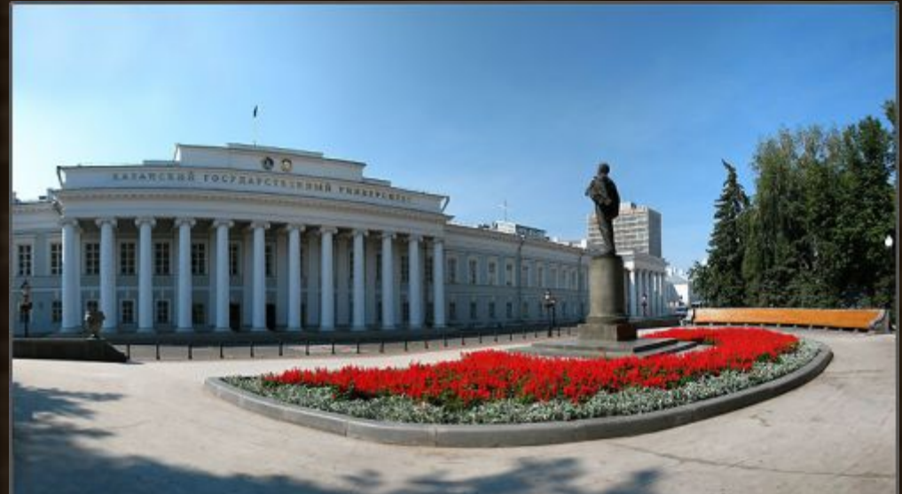
Казанский университет (1804 гг)

1804 г. - Университетский устав предоставлял университетам значительную автономию: выборность ректора и профессуры, собственный суд, невмешательство высшей администрации в дела университетов, право университетов назначать учителей в гимназии и училища своего учебного округа.