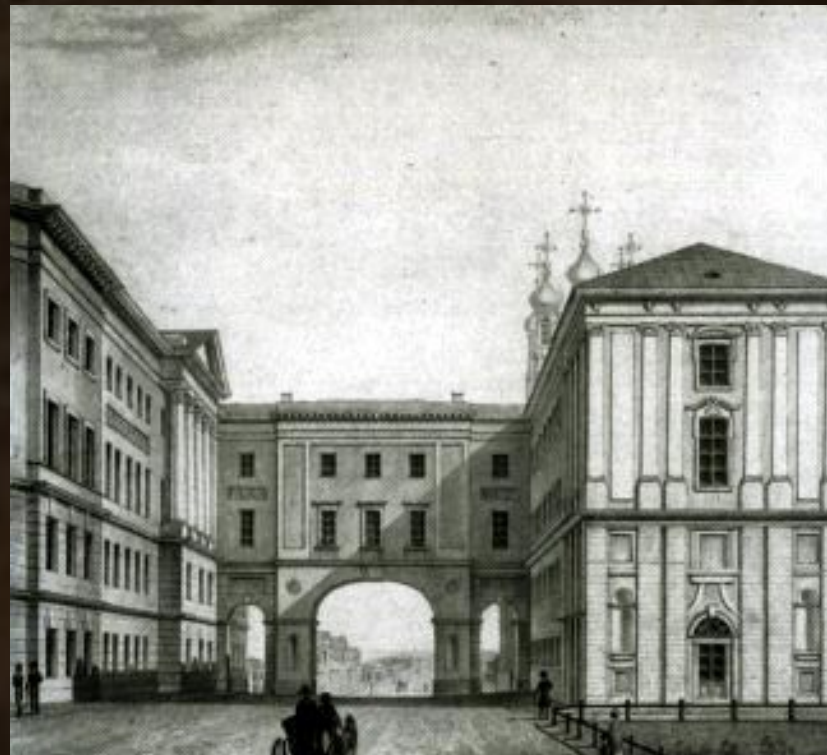
Царскосельский лицей (Пушкинский)

В 1817 г. Министерство народного просвещения было преобразовано в Министерство духовных дел и народного просвещения.