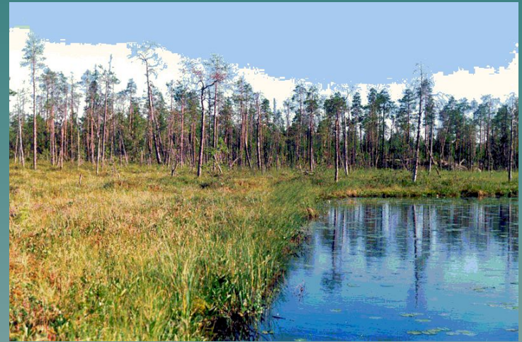
Заболоченный берег озера в Карелии.