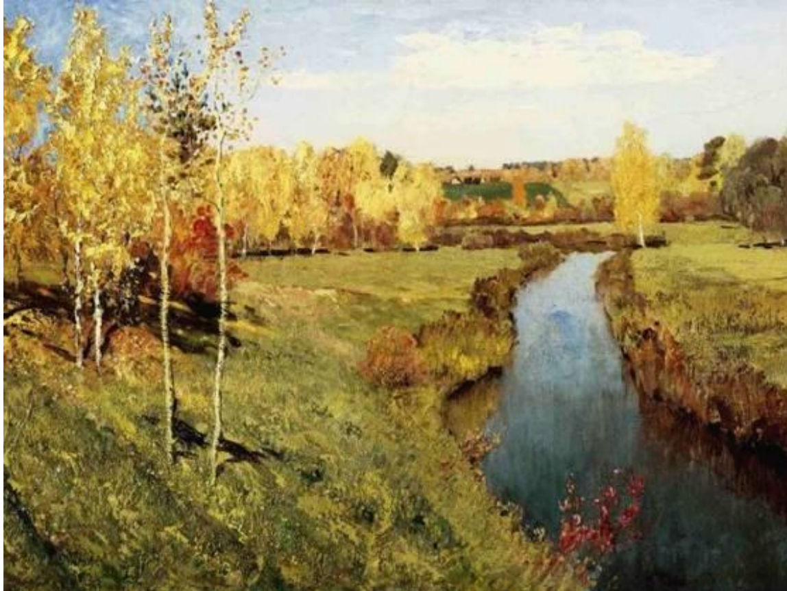
Картина И.И. Левитана «Золотая осень»