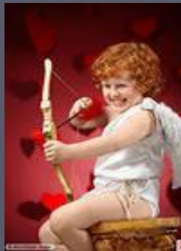
Эрот Бог любви