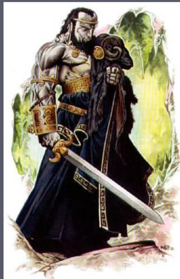
Арес Бог войны