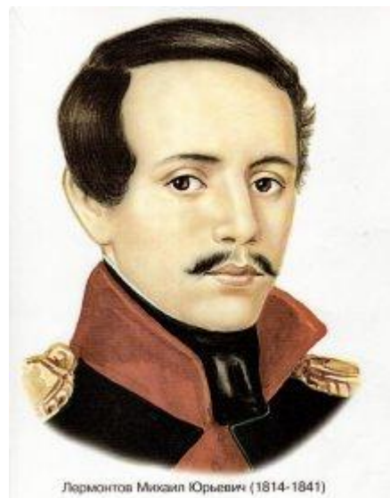
Лермонтов Михаил Юрьевич (1814-1841)