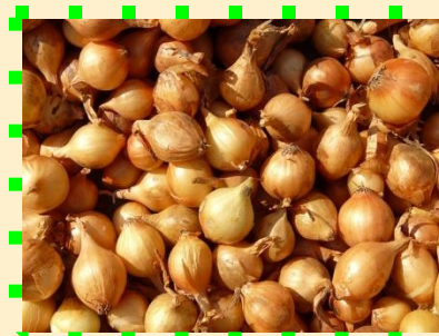
Лук - шалот