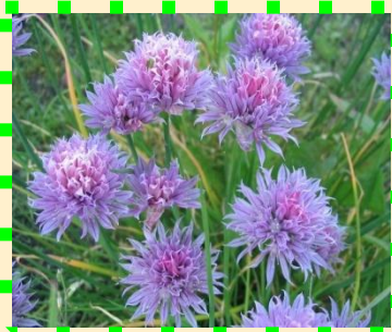
Лук - шнитт