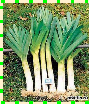
Лук - порей