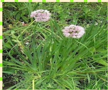
Лук - слизун