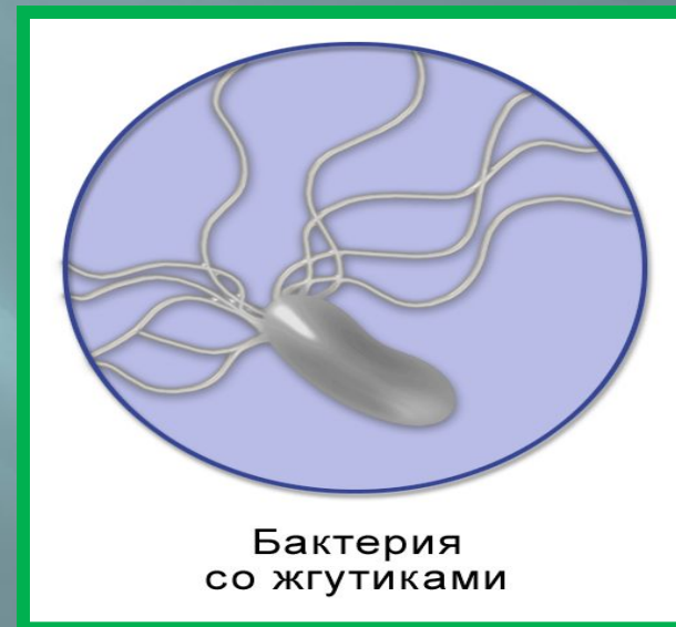
Бактерия со жгутиками

Если на пути невидимых луковых стрел окажутся возбудители болезней – вредные микробы, то они будут уничтожены.