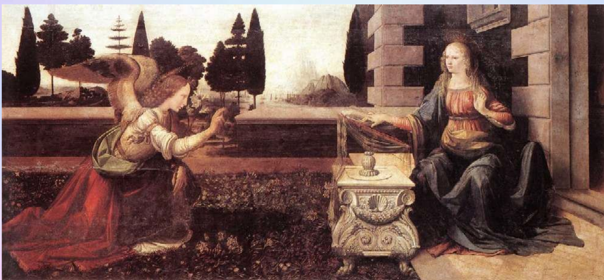
Благовещение (~1472-1475). Галерея Уффици Флоренция, Италия.

В этой большой картине Леонардо основывался, главным образом, на иллюстрированных Библиях 15-ого столетия: Архангел Гавриил становится на колени в саду Девы, которая узнает, что она выбрана, чтобы родить Сына Бога. Средняя часть огорожена низкой стеной, достигающей высоты колена, с маленьким открытием в центре. Это открытие, которое служит фоном жесту приветствия Гавриила, с лилией в левой руке, (символ чистоты Марии) также, показывает дорожку, исчезающую вдали. Видны острые силуэты деревьев и гор, на фоне пылающего неба. Именно Леонардо, первый показал эту библейскую сцену не в закрытом помещении, а использовал мастерски выполненный пейзаж, усиливающий впечатление от картины.