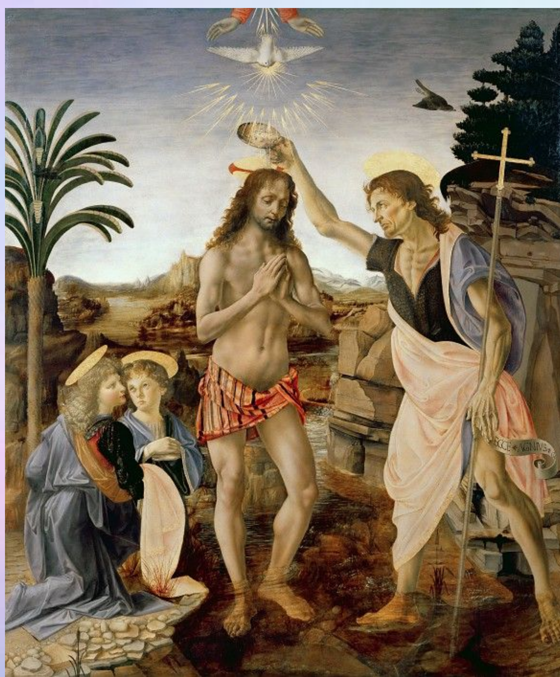
Крещение Христа. 1470-1475. Галерея Уффици,

Будучи прежде всего скульптором, Андреа Верроккьо выполнял живописные заказы с перерывами, вследствие чего одну из своих картин - «Крещение Христа» - никак не мог закончить. Он попросил довершить начатое своего ученика Леонардо да Винчи. Центральные фигуры и ангел справа уже были написаны в типичной для Верроккьо манере - суховатой, линейной, с изысканными силуэтами фигур.