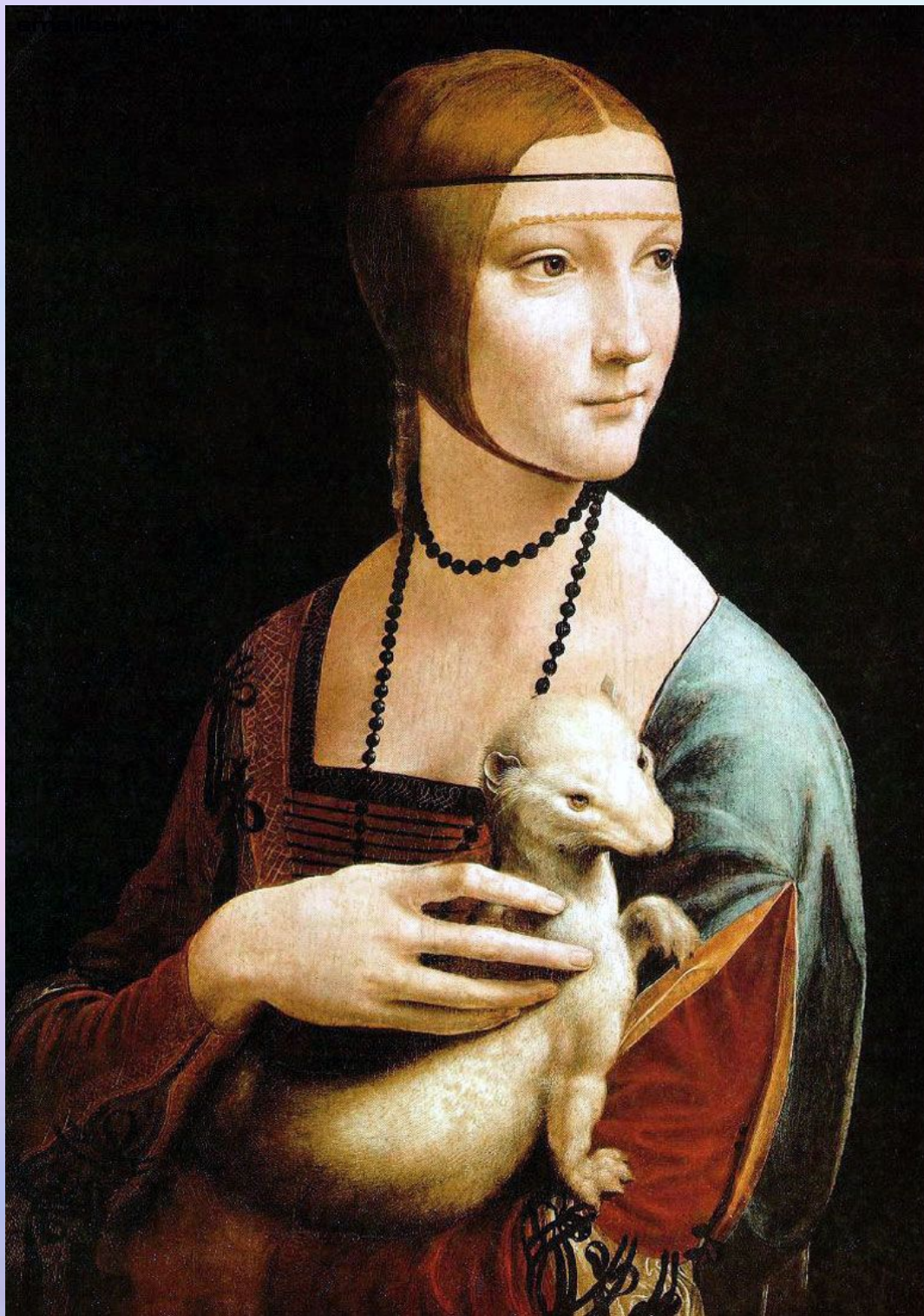
Дама с горностаем 1485-1490 годы. Национальный музей, Краков.

Картина «Дама с горностаем» (или же «Портрет Цецилии Галлерани») написана художником около 1490 года. Портрет хранился долгие годы в музее Чарторыйских. В картине «Дама с горностаем» художник Леонардо да Винчи внес новое в прием объемной моделировки фигуры. Флорентийские мастера издавна славились четкой, подчас даже резкой пластикой своих образов. Леонардо же не любил сильного прямого освещения, дающего слишком резкие тени и блики. Более всего, как известно из «Трактата о живописи» Леонардо да Винчи, художника увлекал свет в сумерках в пасмурные дни, когда лица приобретают особую интимную мягкость. Нечто от подобного освещения есть и в картине, где свет содействует мягкой нюансированной моделировке лица и фигуры, но и сообщает образу Цецилии Галлерани ореол своеобразной романтической поэзии.