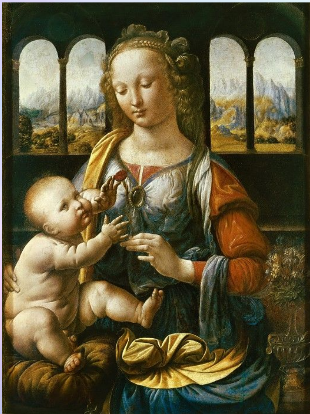
Мадонна с гвоздикой, 1478 Пинакотека, Мюнхен

Её принято датировать 1478 годом, когда художник был ещё очень молод и трудился в мастерской другого прославленного итальянца Верроккьо. И в самом деле, схожие черты у картины с картинами учителя имеются, однако, больше в ней всё же авторских находок. Это проявляется и в технике сфумато, которое представляет нам лик Мадонны как некий отрешённый и высокий образ, и в характере картины, и в композиции. Две основные фигуры полотна даны нам в резком противопоставлении – это смиренная, одухотворённая мать с тонкой изящной гвоздикой в руках и чуть заметной улыбкой на лице, и энергичный непоседливый младенец, который даже упирается ножкой в мягкую подушку, чтобы дотянуться до цветка.