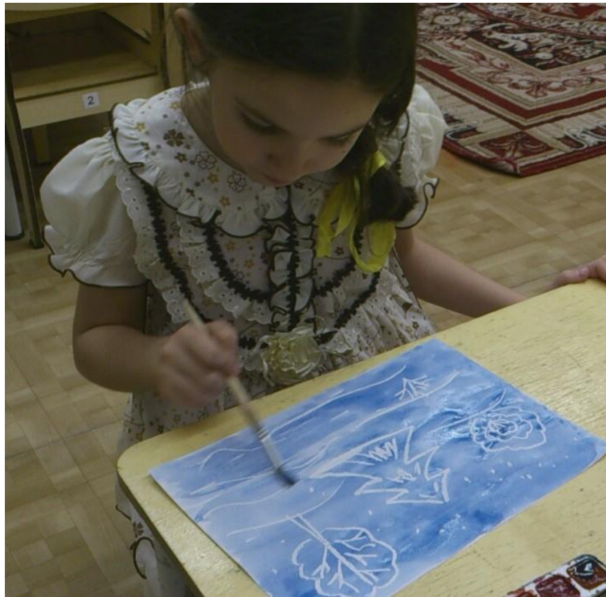
Рисунок наносится при помощи водоотталкивающего материала – свечи или сухого кусочка мыла, невидимые контура не будут окрашиваться при нанесении поверх них акварельной краски, а будут проявляться, как это происходит при проявлении фотоплёнки.