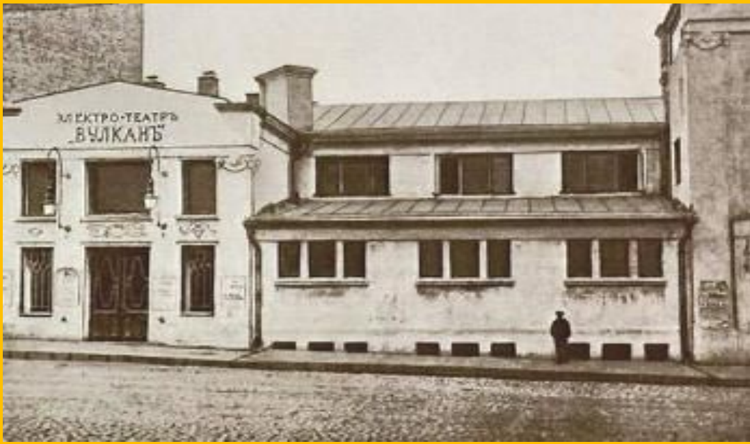
Здание кинотеатра «Вулкан»

В 1908-9 г.г С.Дягилев организовал в Париже «Русские сезоны». В России в н.века появился кинематограф. В 1908 г. вышла 1-я русская картина - «Степан Разин» в 1911 - «Оборона Севастополя». Режиссер Протазанов, актриса В.Холодная, кинопредприниматель В.Ханжонков стали видными фигурами русской культуры.