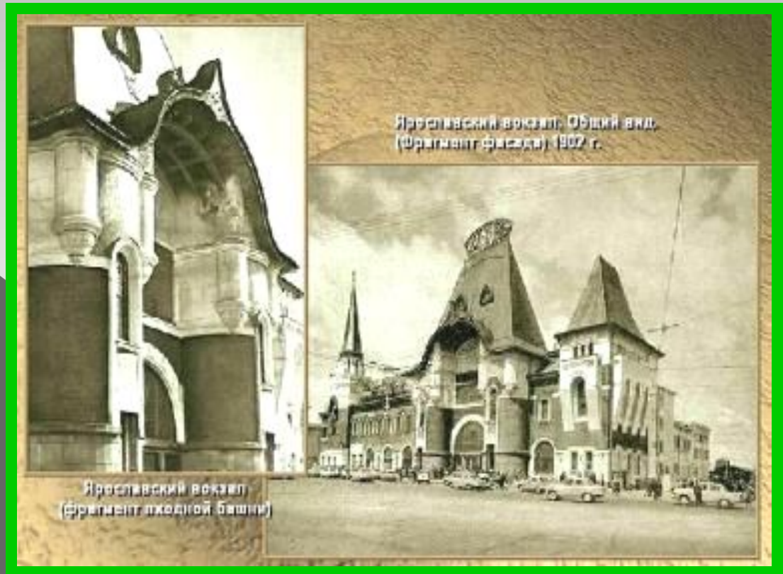
Ф. Шехтель Здание Ярославского вокзала

В архитектуре популярностью пользовался модерн и его разновидность - неорусский стиль. Ф. Шехтель построил здание Ярославского вокзала, особняк С. Рябушинского. Затем он переходит к «рационалистическому модерну» (Банк Рябушинского). В. Валькотт используя эклектику построил в Москве здание гостиницы «Метрополь». Многие здания в столицах возводились в стиле неоклассицизма.