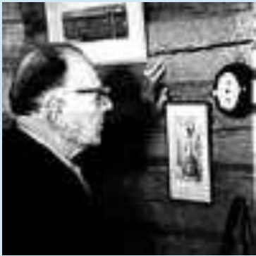
К.Г. ПАУСТОВСКИЙ В КАБИНЕТЕ ТАРУСОВСКОГО ДОМА