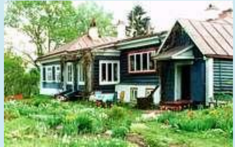
ДОМ- МУЗЕЙ ПАУСТОВСКОГО В ТАРУСЕ