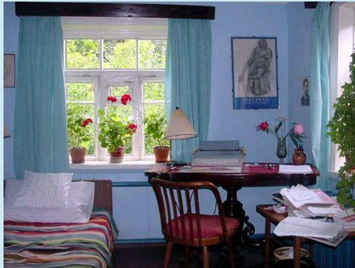
КОМНАТА В ТАРУСОВСКОМ ДОМЕ