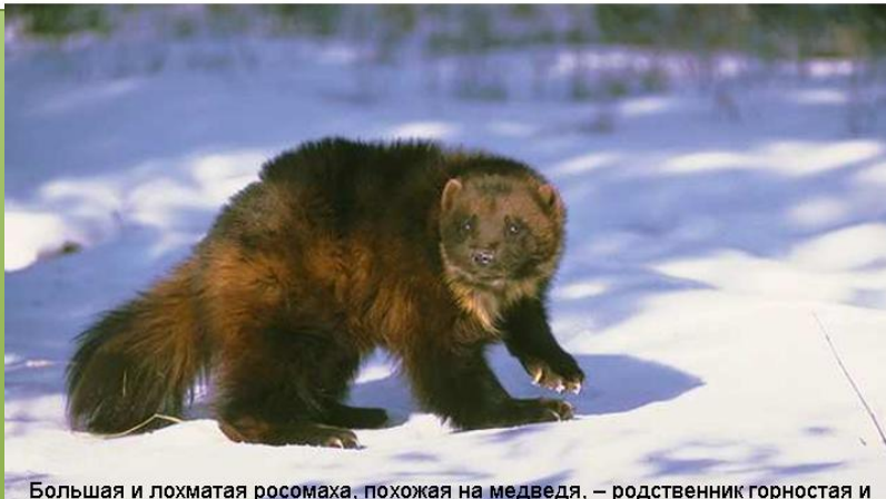
Большая и лохматая росомаха, похожая на медведя, – родственник горностая и соболя. Росомаха осторожна, но бесстрашна, может отобрать добычу у других зверей.