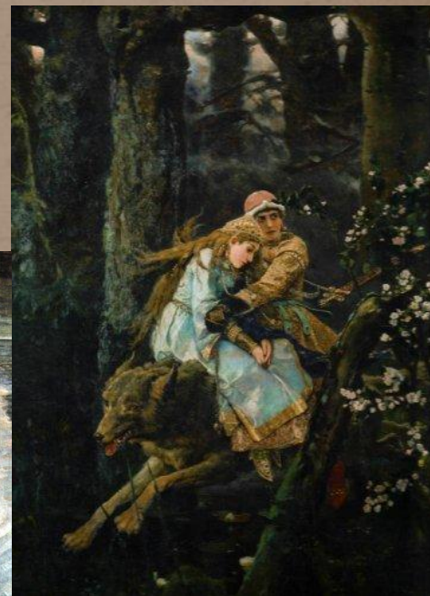
Иван-царевич на сером волке