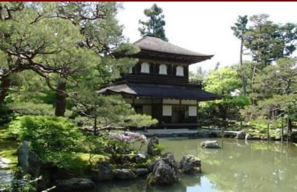
Каменные сады Японии