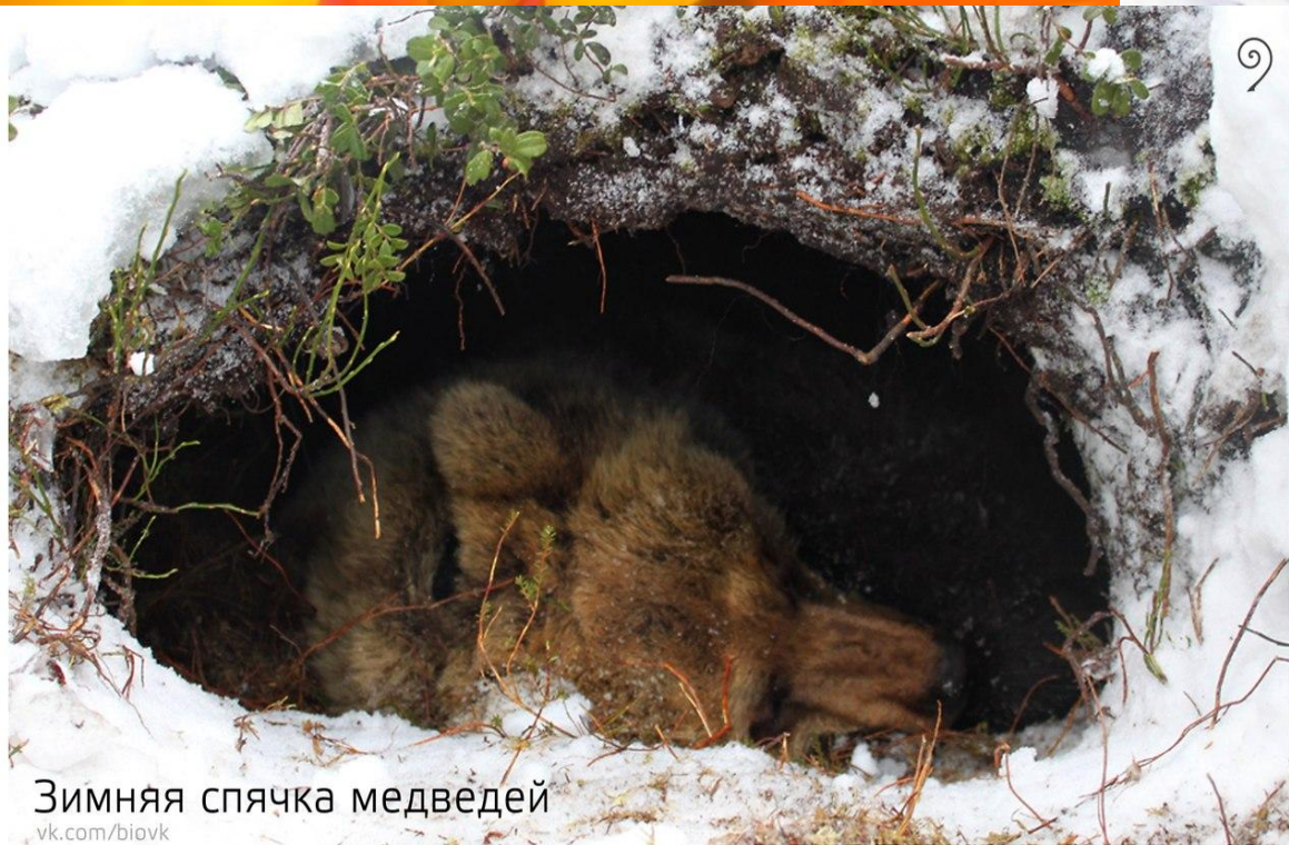
Зимняя спячка медведей