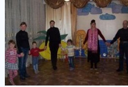
Упражнение «Общий ритм»