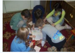
Диагностическая игра «Спасатели» - дошкольная зрелость, автор М. Битянова