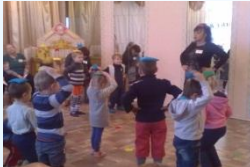
Игровое упражнение «Не урони мешочек»