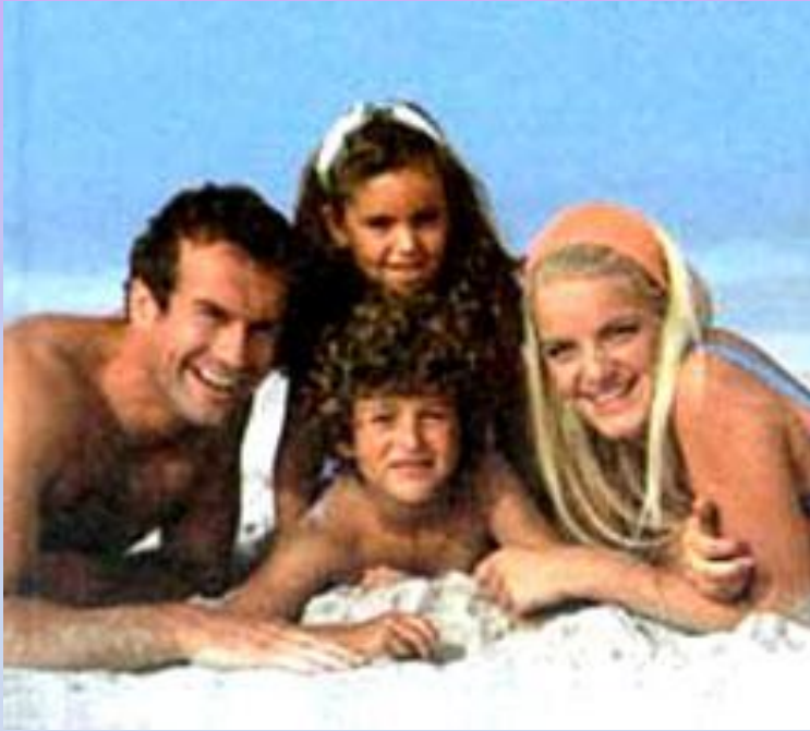
Здоровая семья (2 жетона)