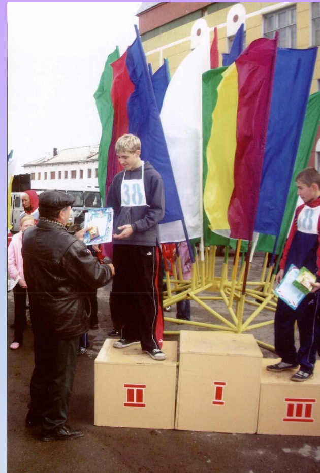
Умение добиваться успеха во всем, чего бы вы ни пожелали (2 жетона)