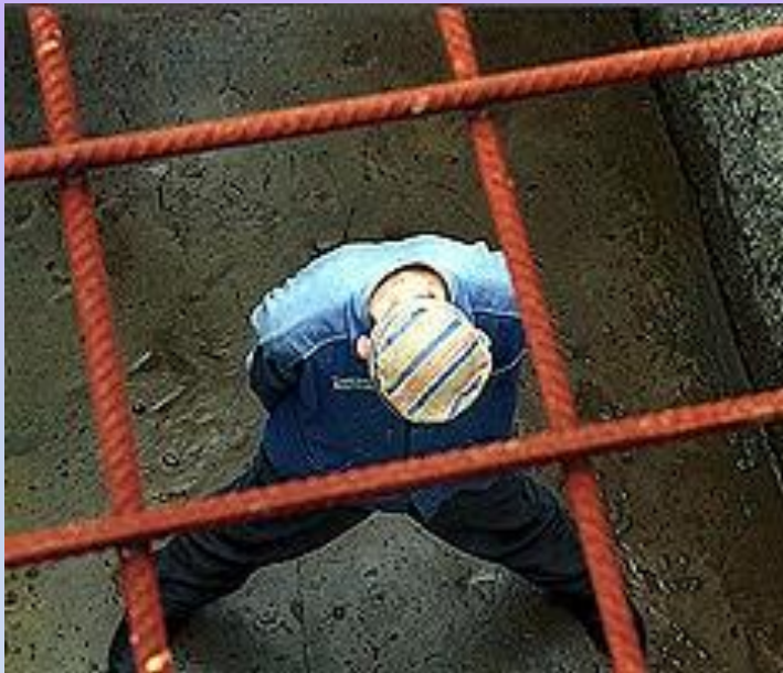
Чистая совесть (2 жетона)