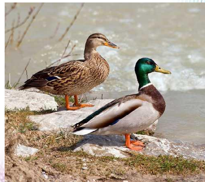
УТКА - КРЯКВА