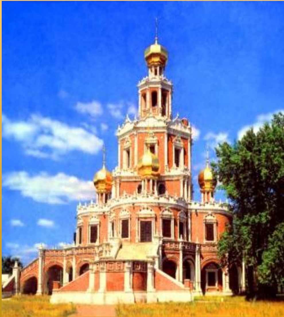
Церковь Покрова в Филях. 1693-1694. Москва.

Блестящим образцом нарышкинского барокко является церковь Покрова в Филях. Она стоит на невысоком холме, над речным берегом, повторяя себя причудливым отражением в воде.