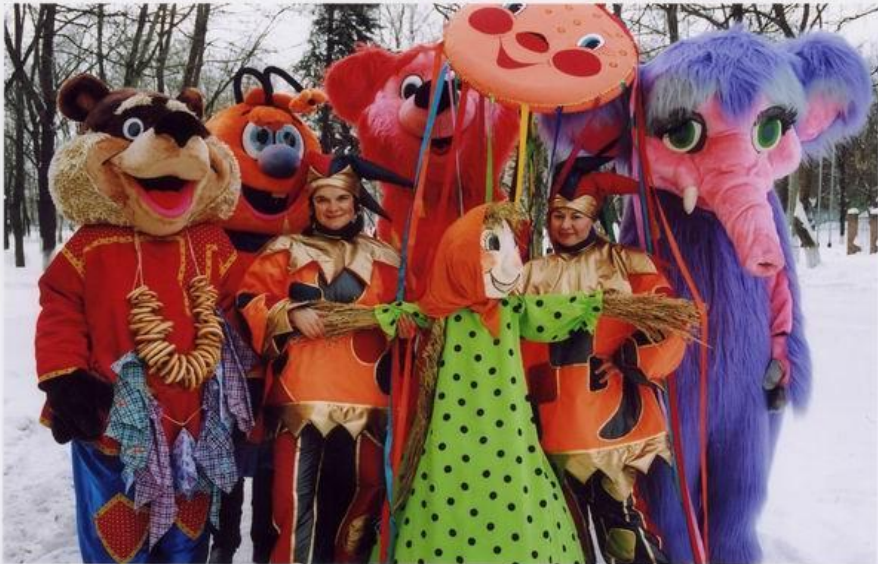
Ряженые веселили народ.