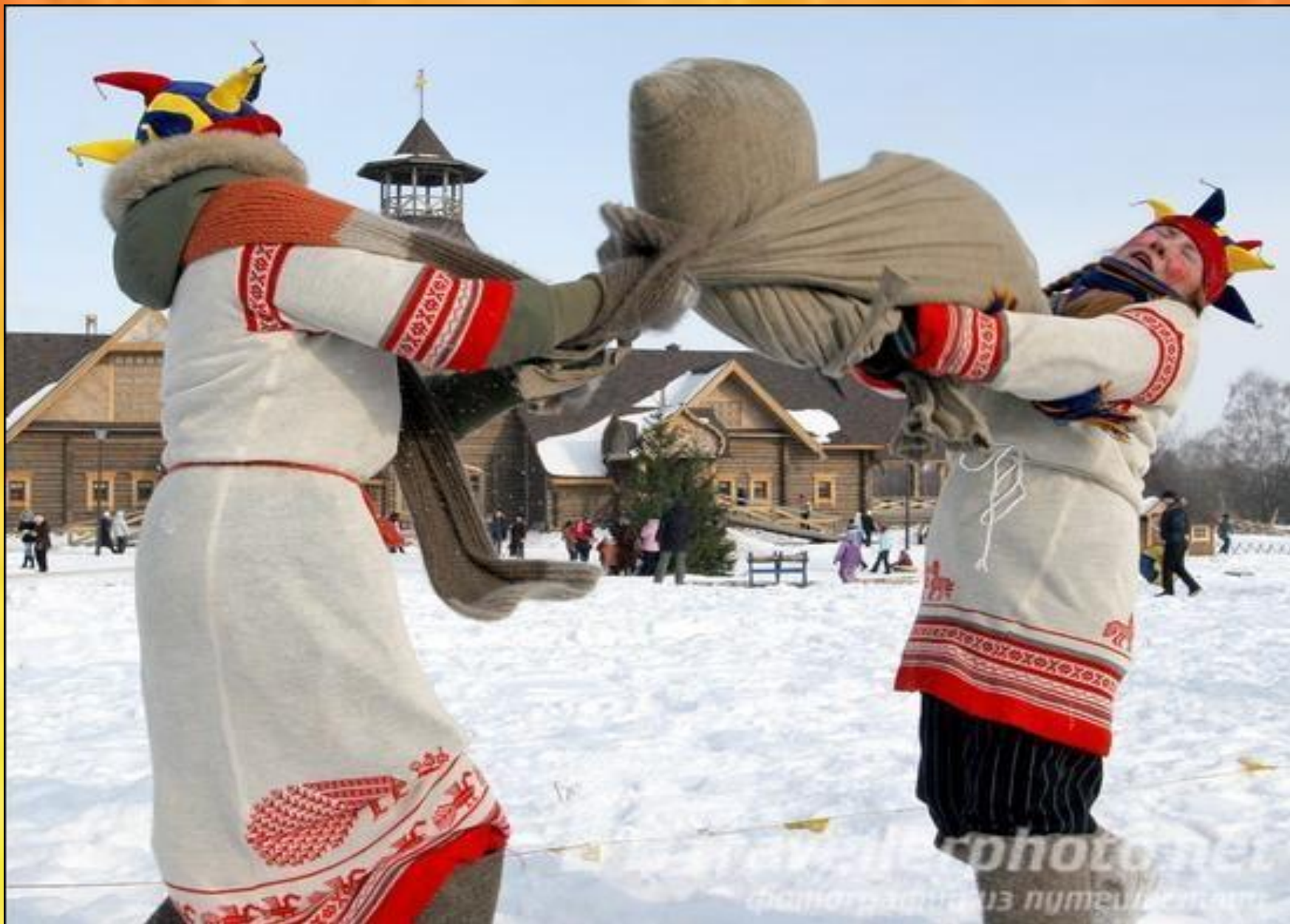
Забава «Бой мешками»