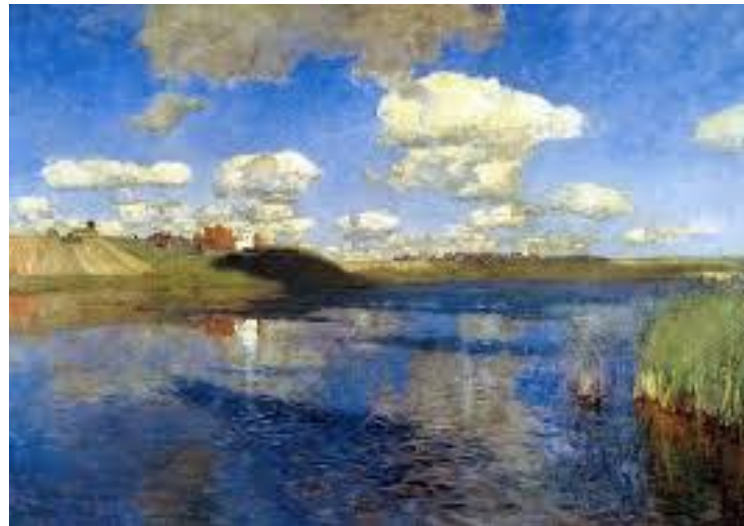
И. Левитан. Озеро Русь