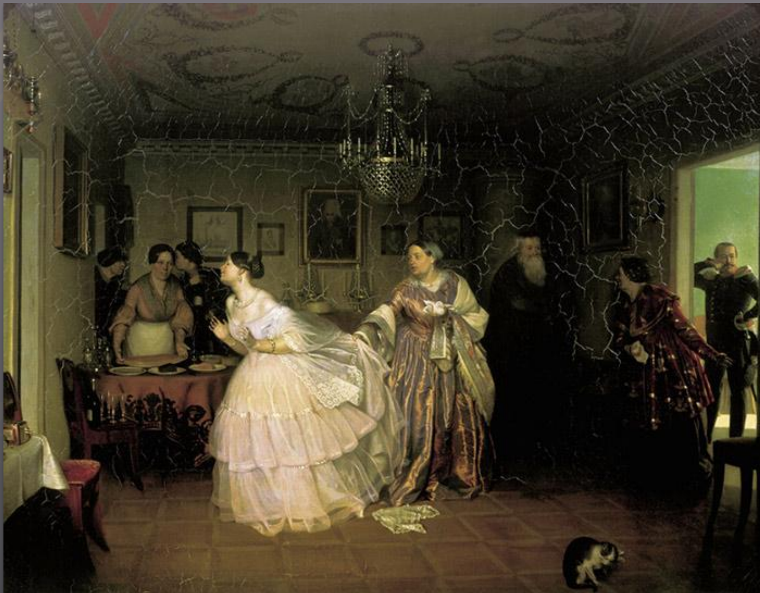
«Сватовство майора» Павел Федотов