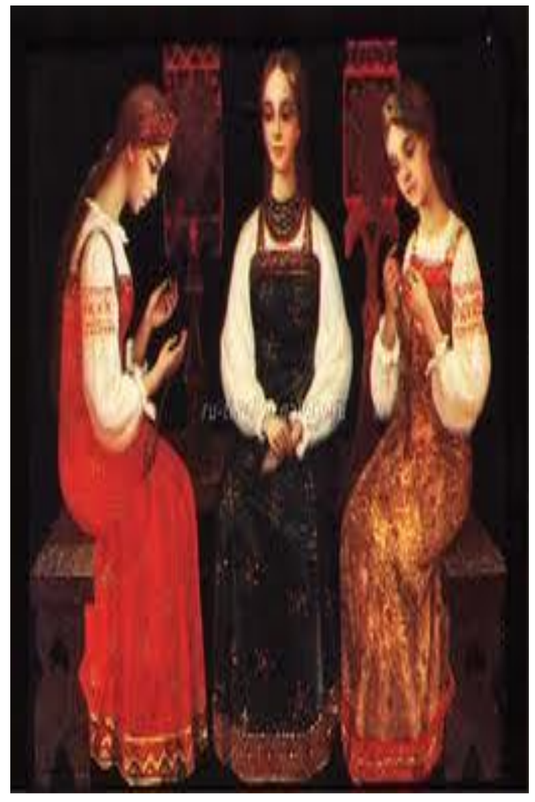
В.Д. Антонов. "Пряхи"