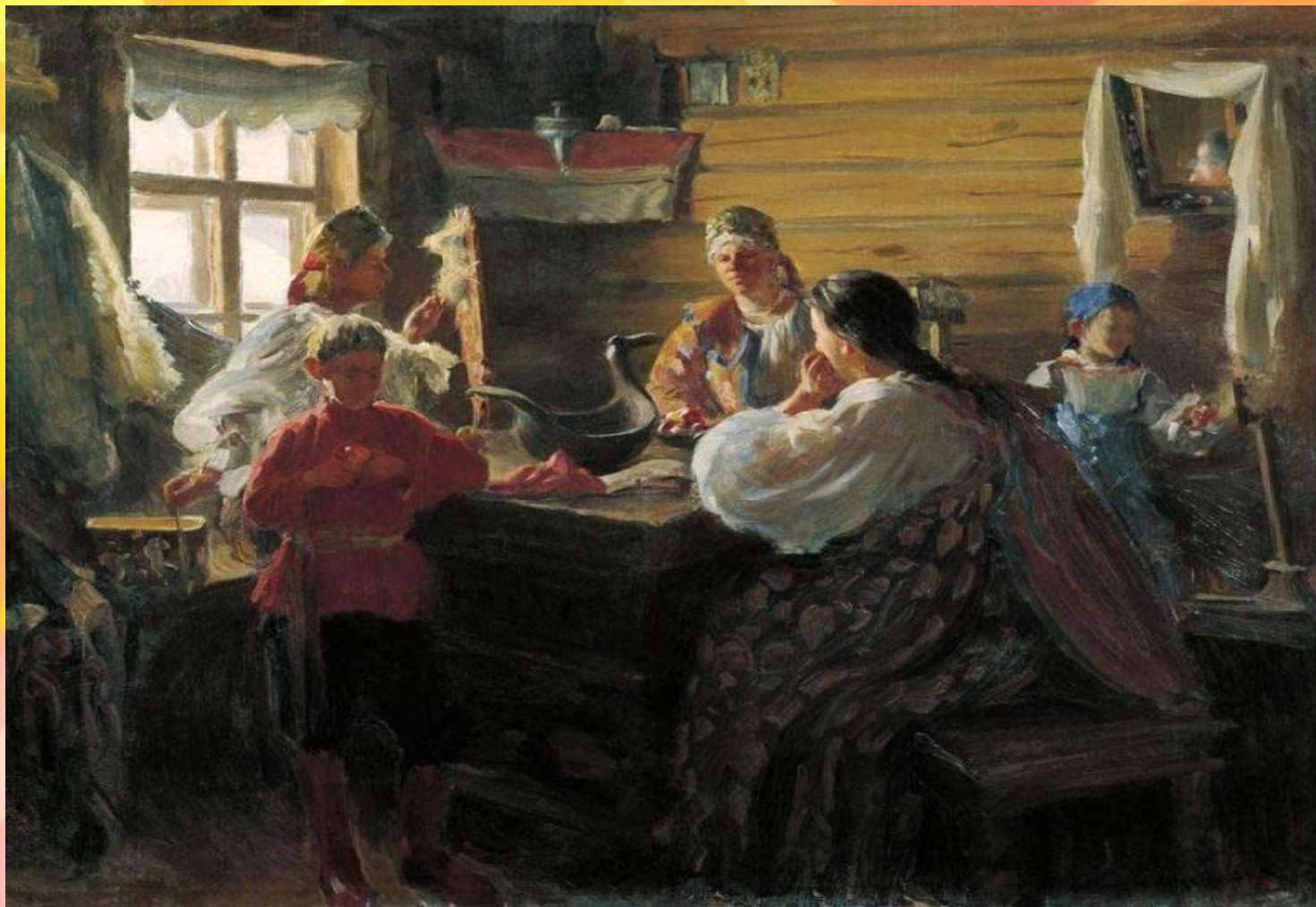
Иван Куликов. Зимними вечерами