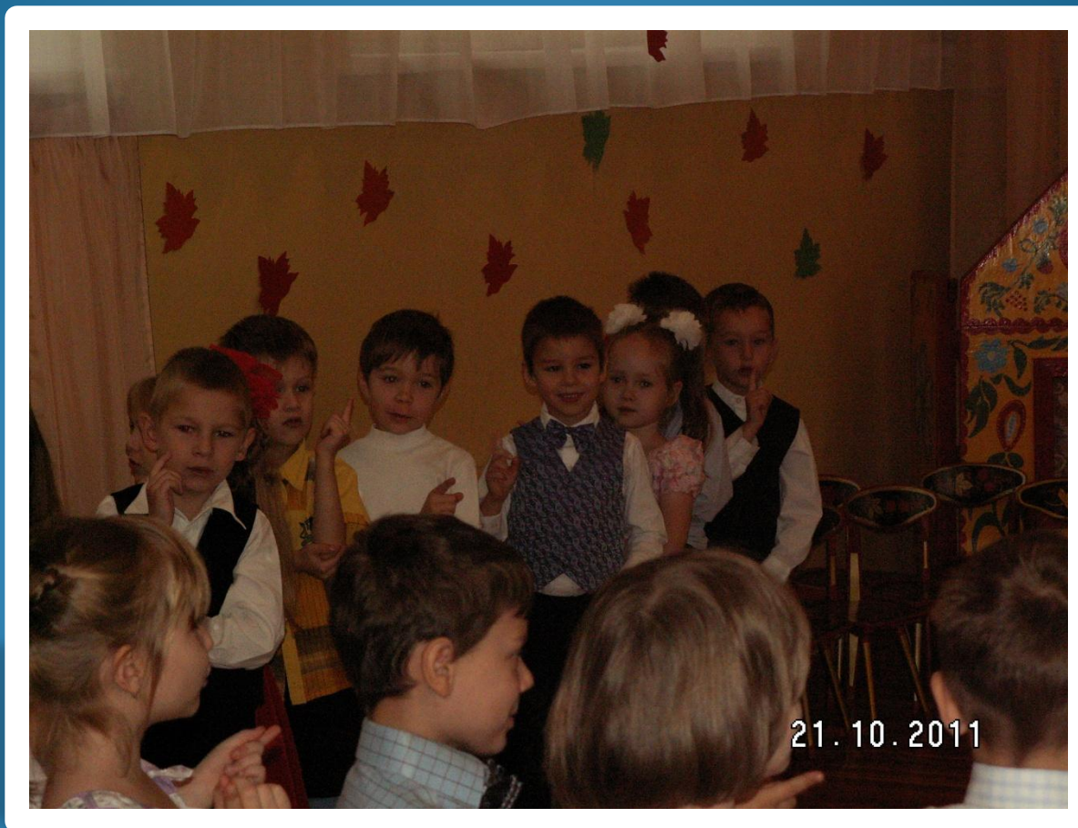
Речевая игра «Сороконожка»