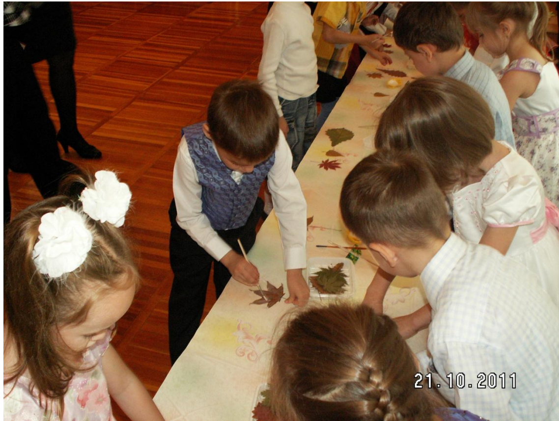
Аппликация «Осенняя дорожка»