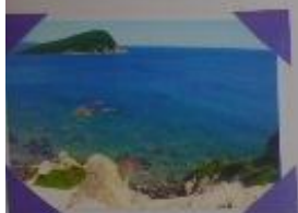
Золотой берег - Мыс Копейкина