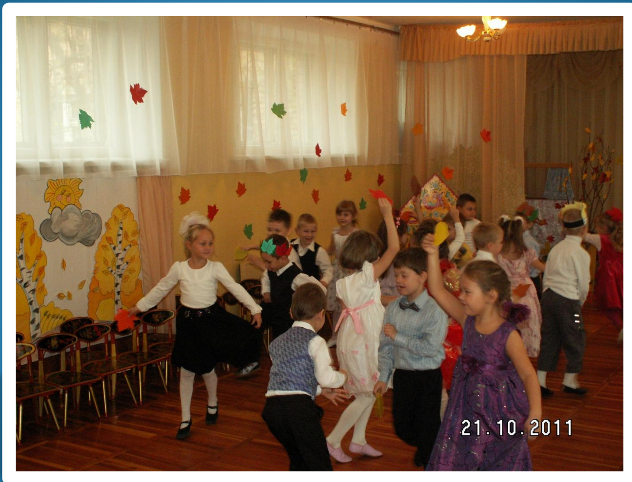
Игра с листьями «Листопад»