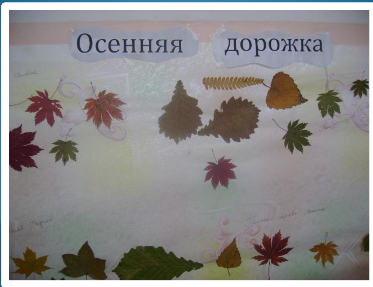
Коллективная работа «Осенние листья»