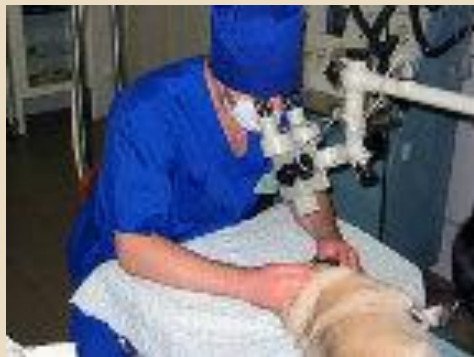
Следит за их здоровьем