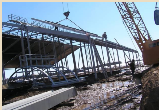
Строит им жилища.