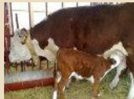
Заботится о потомстве.