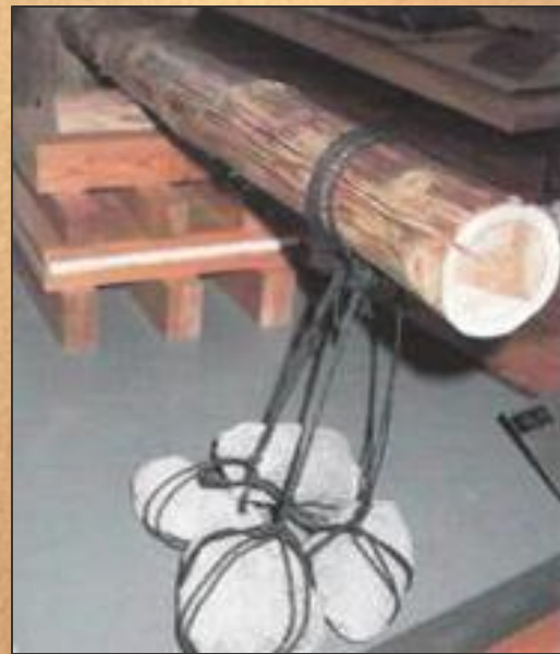
Сушка под прессом