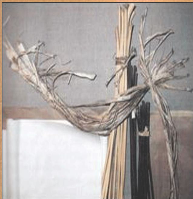
Сырье для производства бумаги

Изобретателем бумаги считают Цай Луня. Он предложил использовать для изготовления бумаги волокна тутового дерева.