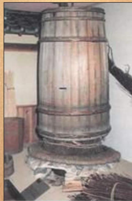
Разогревание бумажной массы