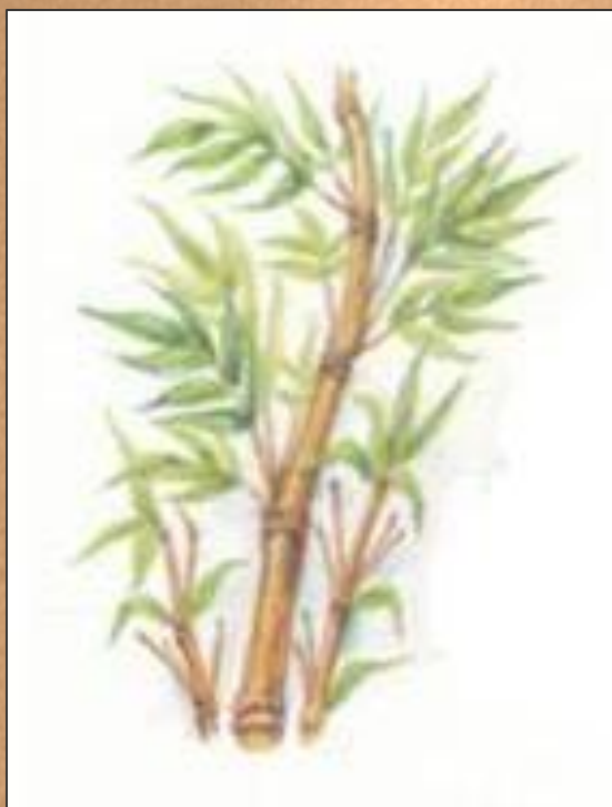
Китай, II век, бамбуковые стебли

Родиной бумаги считают Китай. Сначала сырьем для ее изготовления служили стебли бамбука.