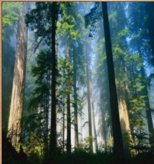
Деревья – сырье для производства бумаги