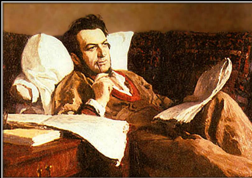
Mikhail Ivanovich Glinka (1803-1857)