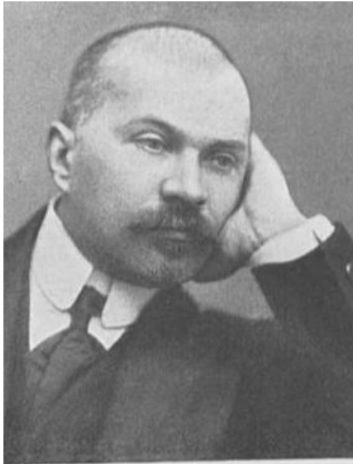
Алексѣй Викторовичъ ЩУСЕВЪ.